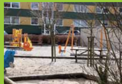
Tabel 25: Taler beboerne med hinanden på tværs af etnicitet og kultur?

I de to boligområder udgør beboere med anden etnisk baggrund op mod 42 % af beboerne. Da boligområderne herved bærer en stor del af integrationen er det interessant at vide, om beboerne taler sammen på tværs af etnicitet og kultur. I tabel 25 herunder fremgår beboernes kontakt på tværs af etnicitet og kultur.