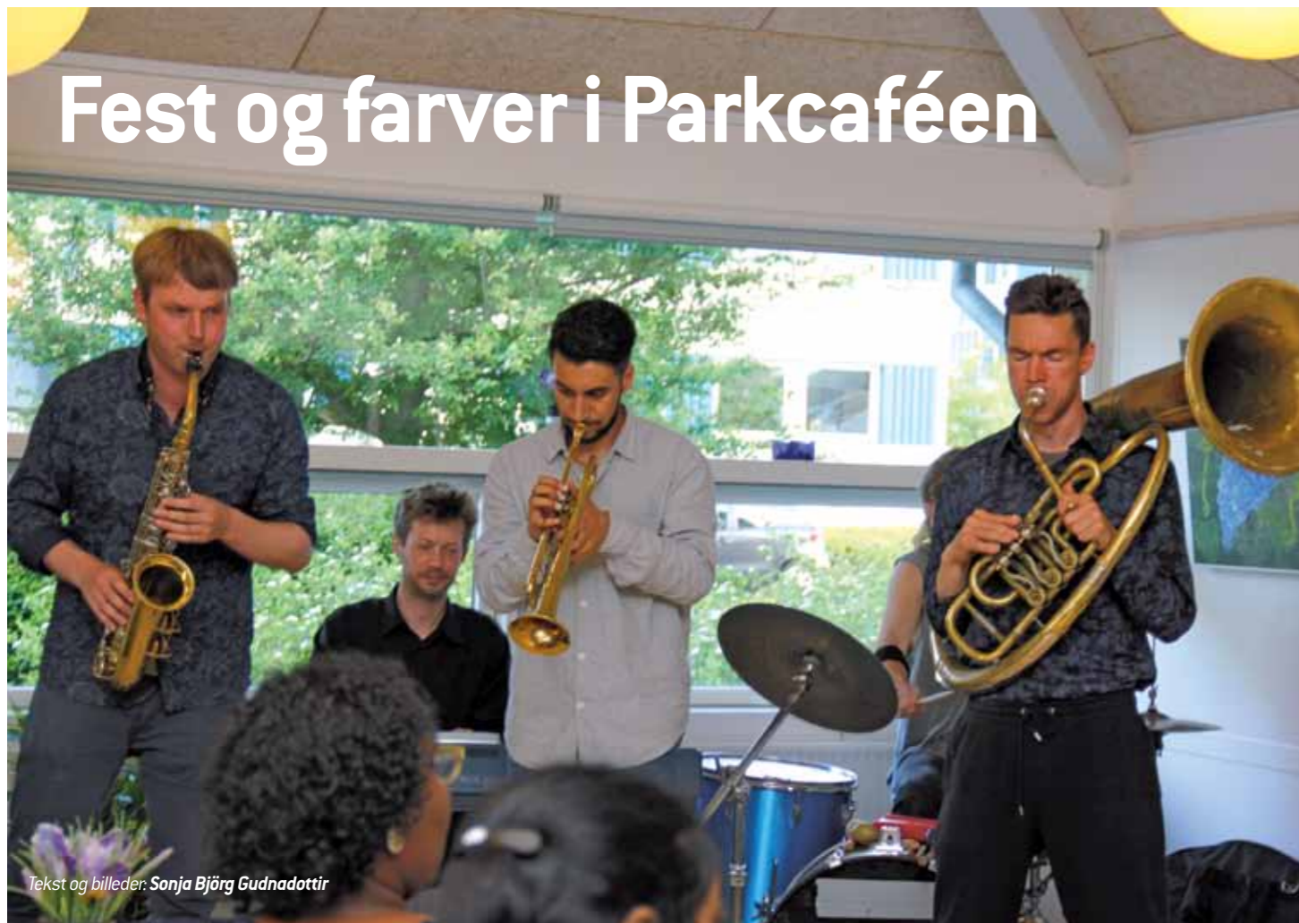
Tekst og billeder: Sonja Björg Gudnadottir

En fredag i maj kunne naboer til Parkcafeen høre skønne balkantoner på den ellers fredelige forårsaften. Der var koncert i Parkcafeen. En del beboere havde iført sig festtøj og indløste billet til en festlig aften.