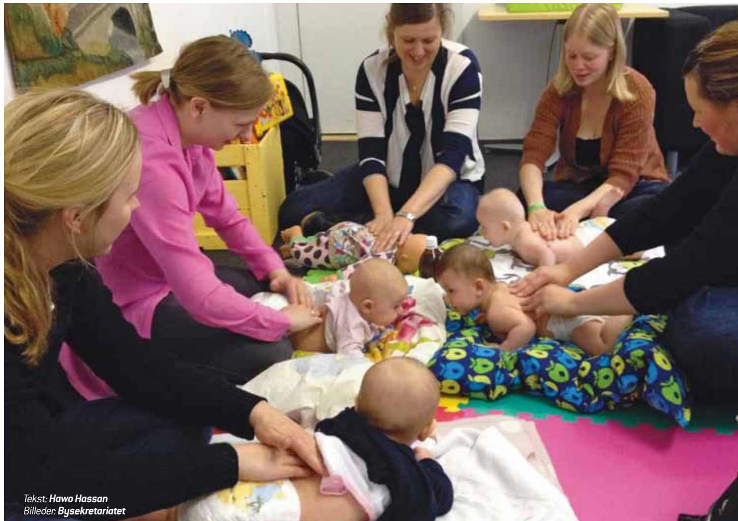
Tekst: Hawo Hassan