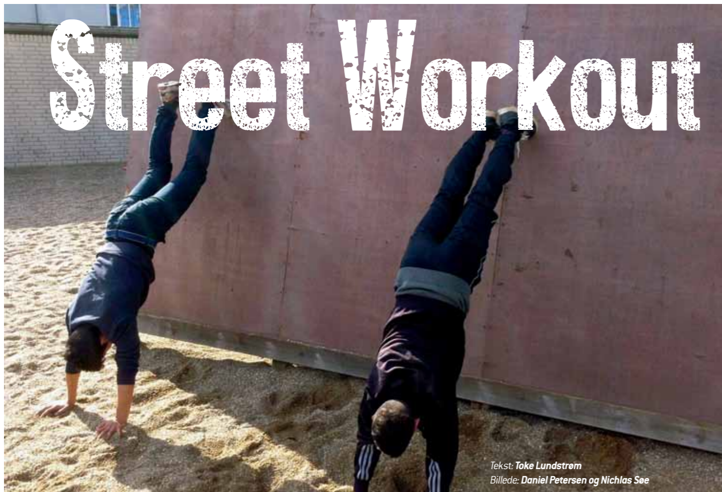
Tekst: Toke Lundstrøm