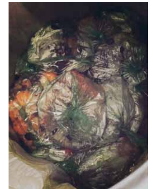
Beboerne omkring Brigadevej er gode til at sortere. Her ses at de både har styr på, at det er madaffald, der skal i den nye undergrundscontainer - og at der skal være knude på posen. Flot start på den nye vane!