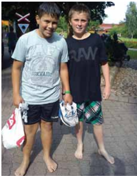
Djurs Sommerland - En bus fuld af glade beboere kom af sted til Djurs Sommerland den 18. august. Hedebølgen gjorde vandet ret inviterende!