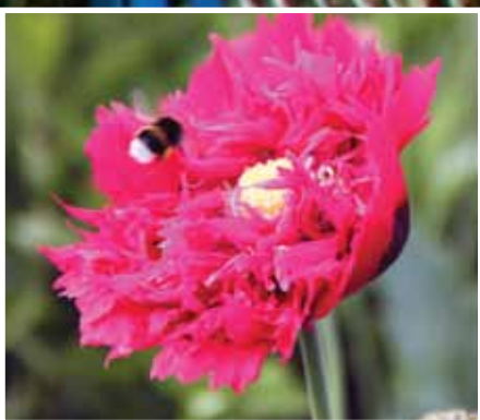
Haverne blomstrer igen - der er fire på venteliste!