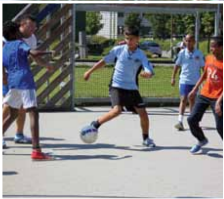
Fodbold turnering – Aktivitetsforeningens Børne- og unge udvalg kom med deres første aktivitet. Vejret var med os, og alle havde tre rigtig gode dage med fodbold vanvid (og vandkamp til sidst). En speciel tak til de frivillige dommere, som var med.