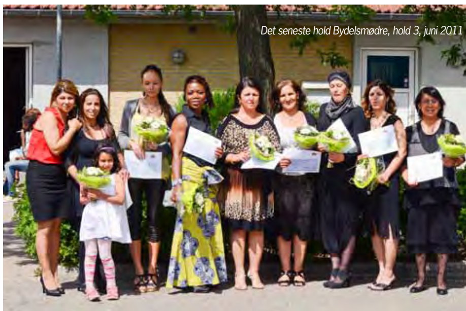
Det seneste hold Bydelsmødre, hold 3, juni 2011