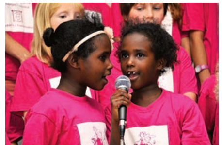
Pigekoret sang blandt andet de sange, som de optrådte med i forbindelse med Dronningens besøg i Nordbyen i september.