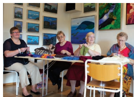
Fontænenes udstillere venter spændt på Dronningens ankomst.

Ud over bydelsmødrene hilste dronningen under sit besøg i beboerhuset også på et par kunstnere fra det kreative værksted Fontænen, der havde lavet en udstilling af malerier og kunsthåndværk i huset. Der var utroligt mange smukke malerier og fantastiske kunsthåndværk. Dronningen så med stor interesse på de mange flotte kreationer.