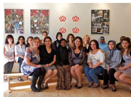
De stolte bydelsmødre