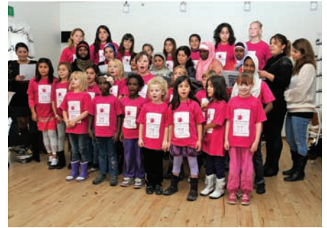
...Så kom "Pigekoret ved Jennumparkens Fritidshjem" og sang med.

Alle billeder er taget af fotograf Jeannot Huyot. Tekst af Christian Sloth.