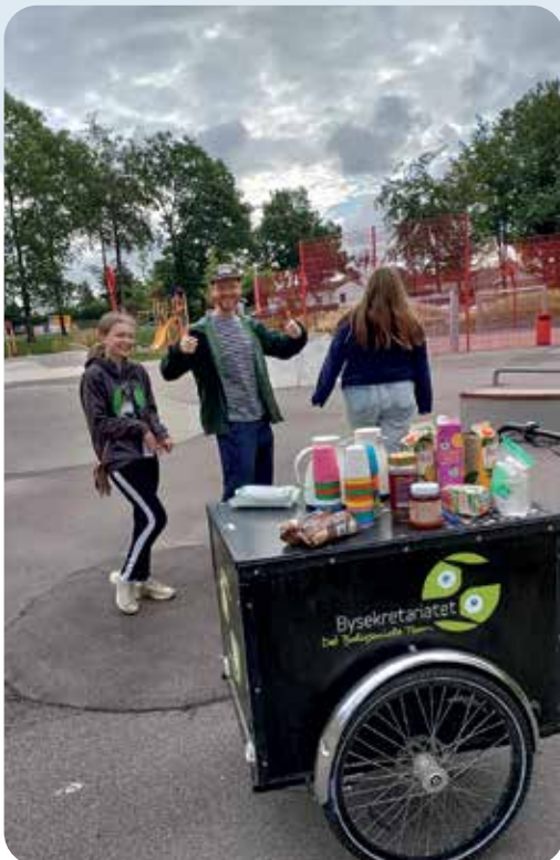
Legpatruljen var med til at skabe hygge i områderne