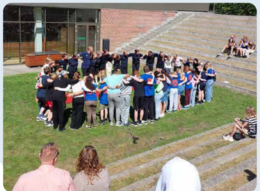
Camp: 10 skønne børn og unge fra det nordlige Randers var i sommerferien i Viborg hvor de deltog i en camp fyldt af læring og socialt samvær