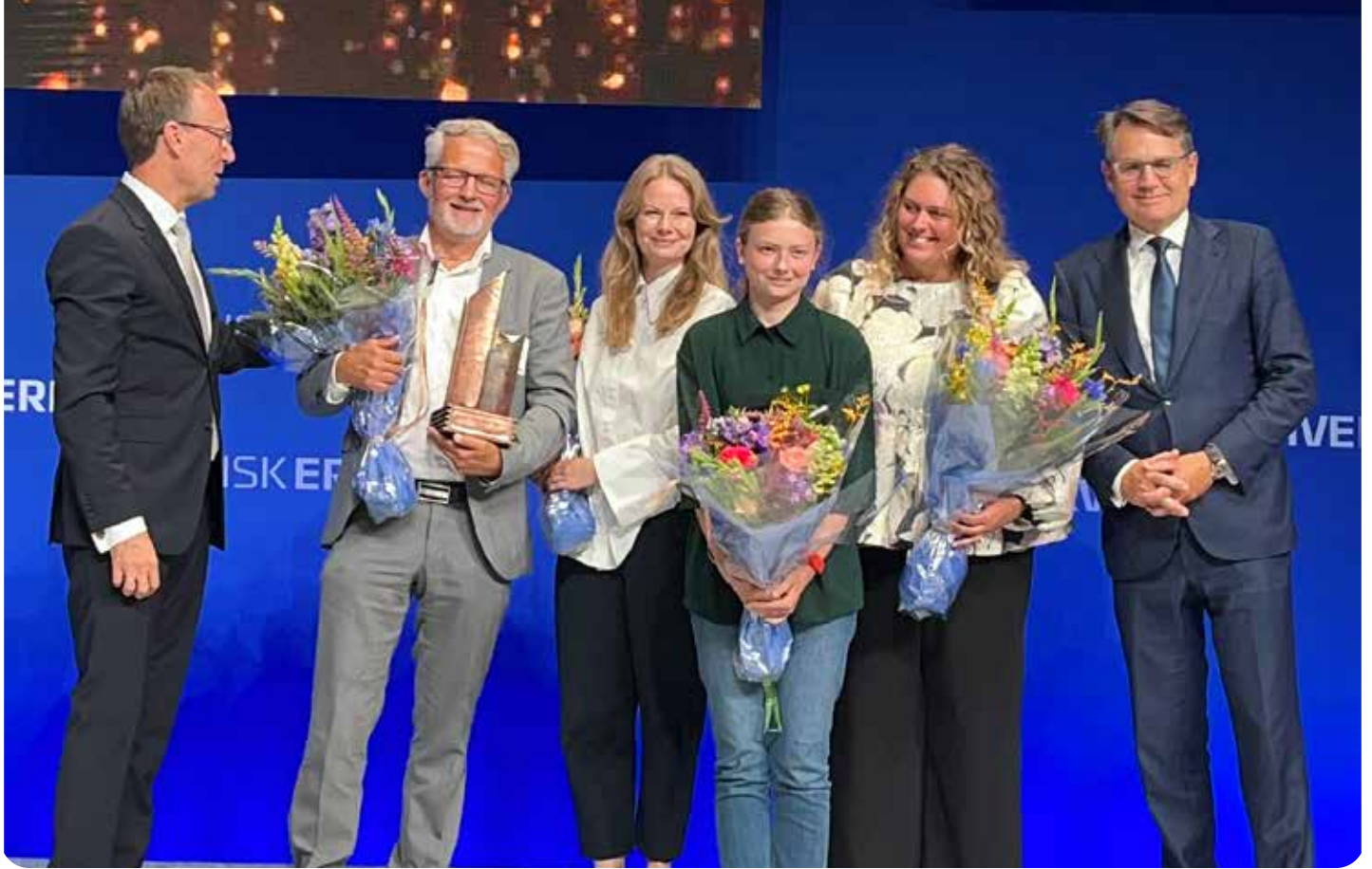
BL modtog Dansk Erhvervs pris for social indsats 2024. En af vores dygtige Ung trænere deltog i prisoverrækkelsen.

”Jobbet har udviklet mine sociale kompetencer. Jeg snakker rigtig meget med børnene, og når fodboldtræningen er slut, kan jeg også finde på at snakke med deres forældre. Det havde jeg ikke modet til at gøre i starten. Så jobbet har givet mig virkelig meget personligt,” siger hun .