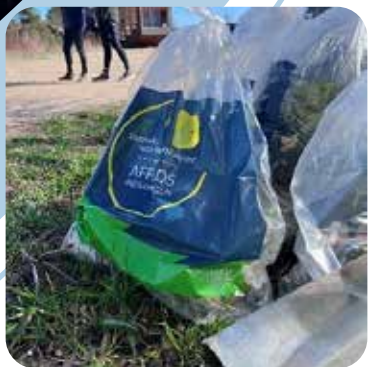
Skraldeindsamling i Nordbyen.